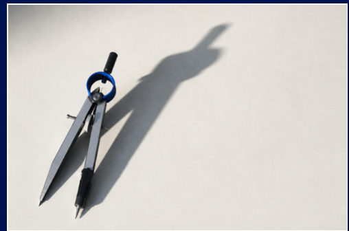
FIG. 01 · O COMPASSO PRECISÃO É MÉTODO, NÃO SORTE

[Contexto] Sou _____. A situação é _____. O público é _____. [Lente] Aja como _____. [Alvo] Quero que você ____ (verbo forte). [Régua] Tom _____. Tamanho _____. Evite _____. [Output] Entregue em ____ (tabela / lista / e-mail / passo a passo).